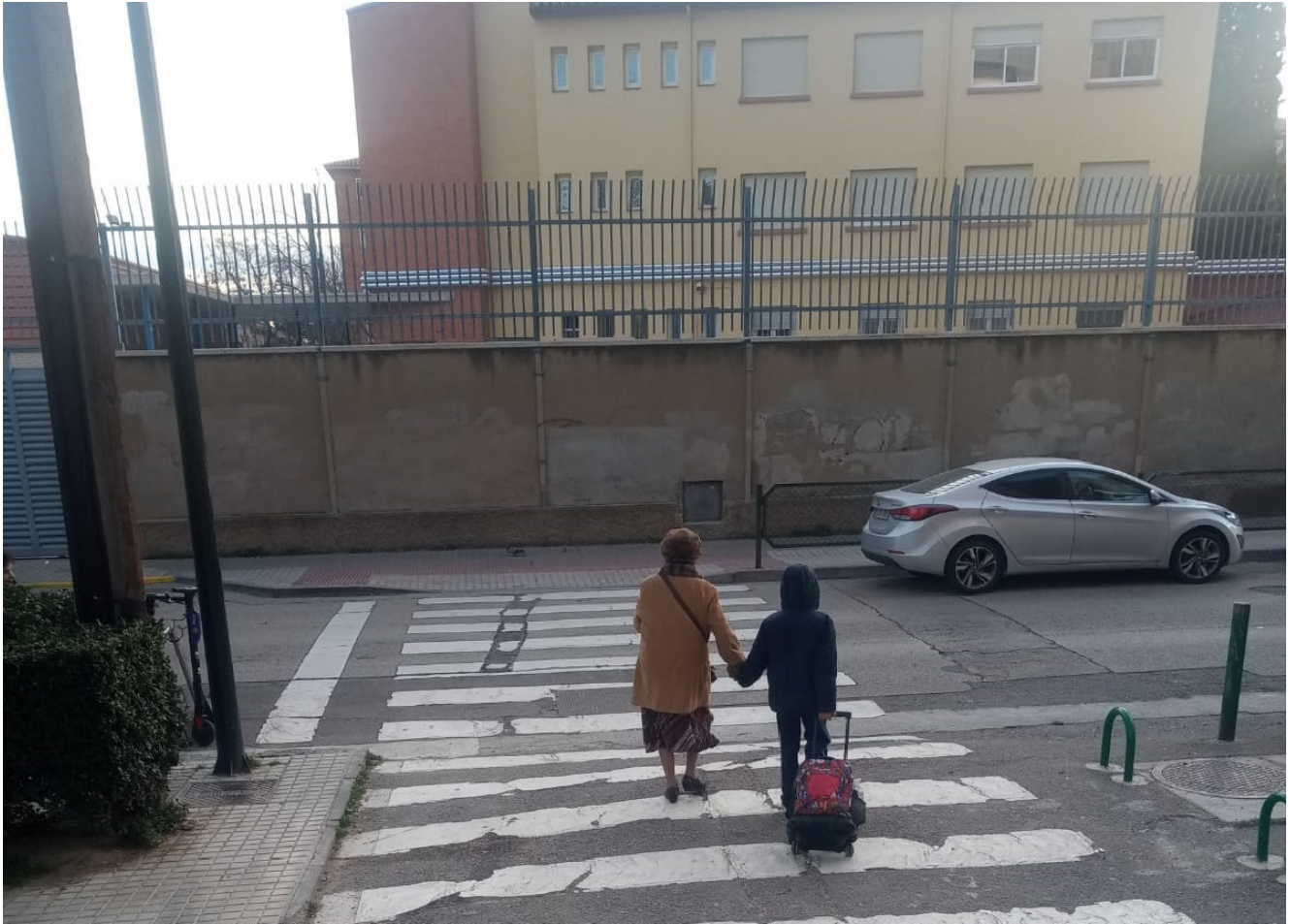
Jo le sueltas la mano. Autora: Rafaela Tirado. 3er Premio Campaña 2019-20