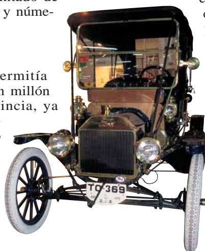
PIONEROS. En 1911, este Ford se matriculó en Toledo con un la placa TO-369.

Un mes después —7 de octubre—, Madrid dio la matrícula M-0000-A a un 'Renault-4' de Hidroconstrucción.